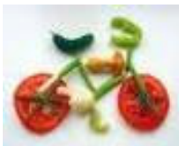
Vegetarisch Menü B

Gemüsepfanne in Soße / BIO-Reis /i /- / Stracciatella Quark /g /